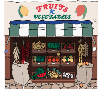
متجر الفواكه والخضروات